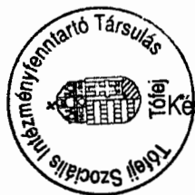
Készítette: Varga János családgondozó